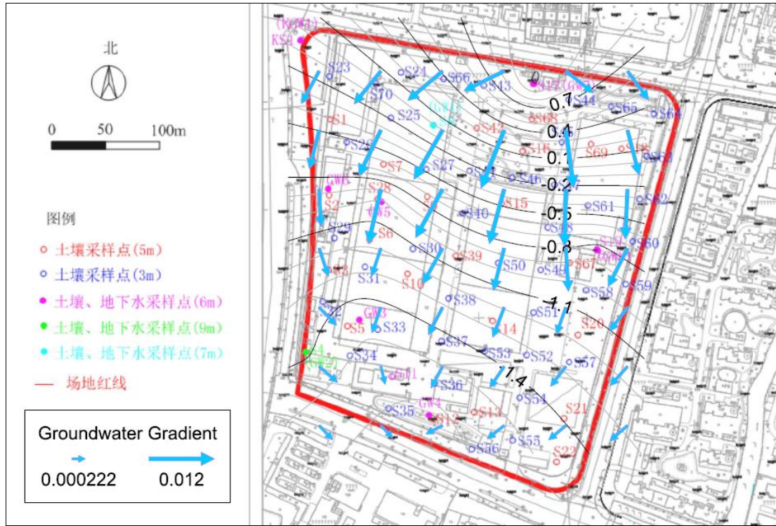
图 2 地下水（潜水）流向图