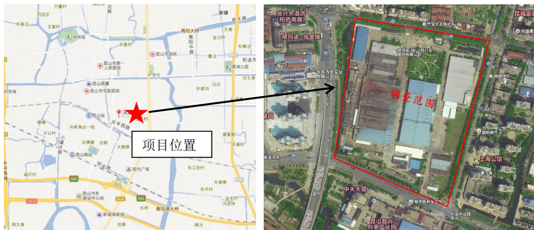
图1 项目地理位置及调查范围

禧玛诺(昆山)自行车零件有限公司位于江苏省苏州市昆山合兴路439号。地理位置详见图1。